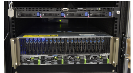
Tesla P100を8基搭載したNVIDIA DGX-1

の、動画解析はまだ難しい状況だという。なぜなら、例えば映像が動いている場合、その動きが撮影者によるものなのか、それとも撮影対象によるものなのかを認識する必要が出てくるなど、これまで以上にチェックすべきポイントが増えてくるからだ。これは当然、これまで以上に計算量が増えることを意味し、動画解析ではさらなるマシン性能の向上が求められることとなる。